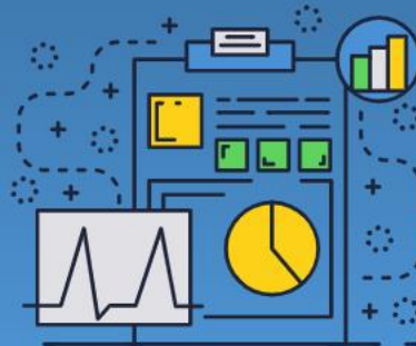
健診結果 管理機能