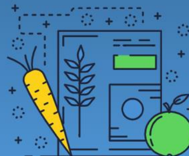
保健指導 システム