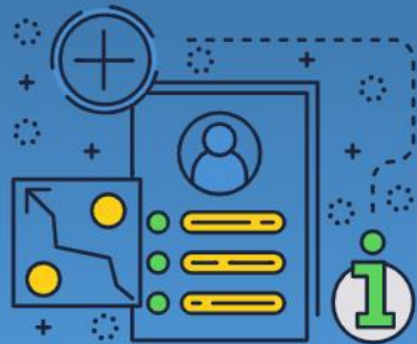
新型コロナ 体温管理機能