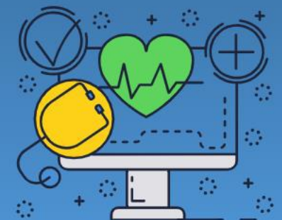
血圧・体重 管理機能