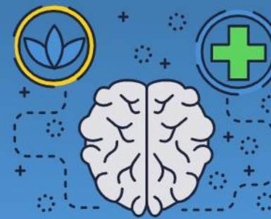
ストレスチェック テスト・管理機能